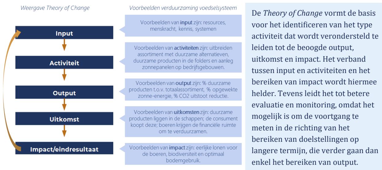
Figuur 1. Theory of Change.

Bij de beoordeling en categorisering van indicatoren die uit de rapportages van de supermarkten zijn gedestilleerd, is het van belang oog te hebben voor het niveau van de Theory of Change waarop deze betrekking hebben (zie figuur 1). Wanneer we kijken naar de indicatoren die op dit moment worden gehanteerd in de duurzaamheidsverslaglegging valt op dat veel indicatoren op activiteitsniveau zijn beschreven. Er wordt vrij weinig tot niets vermeld over de output en outcome van deze activiteiten. Zo wordt niet duidelijk of de activiteit ook daadwerkelijk de gewenste impact heeft. Ter illustratie, meer aanbod van vleesvervangers/duurzame alternatieven (activiteit) zegt niks over de daadwerkelijk verkoop hiervan (output) of het bespaarde water, de vermeden CO 2 -uitstoot of het vermeden dierenleed (outcome). Dit komt de transparantie niet ten goede.