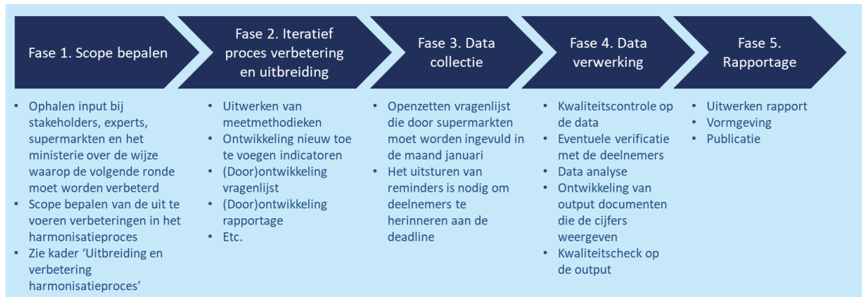
Figuur 4. Terugkerende fases in datacollectie- en rapportageproces.

Na de organisatie van het voorwerk (fase 0) volgen jaarlijks terugkerende fases in het datacollectie- en rapportageproces. De onderstaande activiteiten (figuur 4) herhalen zich dus elk jaar. Het overzicht geeft een globaal beeld van de activiteiten per fase.