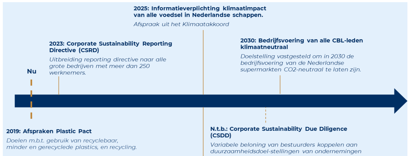
Figuur 3. Enkele aankomende (internationale) rapportageverplichtingen.

Het harmonisatieproces is een continu (internationaal) ontwikkelproces. Aansluiting en monitoring van ontwikkelingen in internationale rapportagestandaarden en -richtlijnen is van belang. Beleid op transparantie van duurzaamheidsrapportage dient aan te sluiten bij bestaande en toekomstige (Europese) standaarden, zoals de CSRD, de EU Code of Conduct on Responsible Food Business and Marketing Practices en CDDD. Vanaf 2023 verplicht de CSRD de bedrijven om veel strenger te rapporteren over duurzaamheidsdoelstellingen. Onderstaande figuur geeft een routekaart op hoofdlijnen van de (internationale) rapportageverplichtingen.