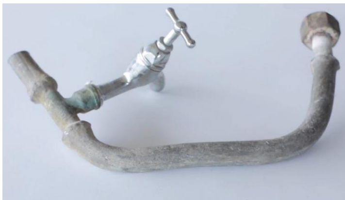
Figuur 3 : Loden leiding

Op 2 juli 2020 hebben de ministers van Binnenlandse Zaken en Koninkrijksrelaties, Infrastructuur en Waterstaat en van Medische Zorg in een gezamenlijke brief de Tweede Kamer verder geïnformeerd over welke acties er tot dan toe samen met diverse betrokkenen zijn ingezet en wat de (vervolg)aanpak inhoudt. In deze brief is voor de monitoring van lood in drinkwater onder meer aangegeven dat de reguliere monitoring door de drinkwaterbedrijven ook in de toekomst gebruikt wordt voor een globaal inzicht in de verdere ontwikkeling van de aanwezigheid van lood in drinkwater. Ook in deze rapportage is daarom een analyse van de individuele loodmetingen in 2021 opgenomen.