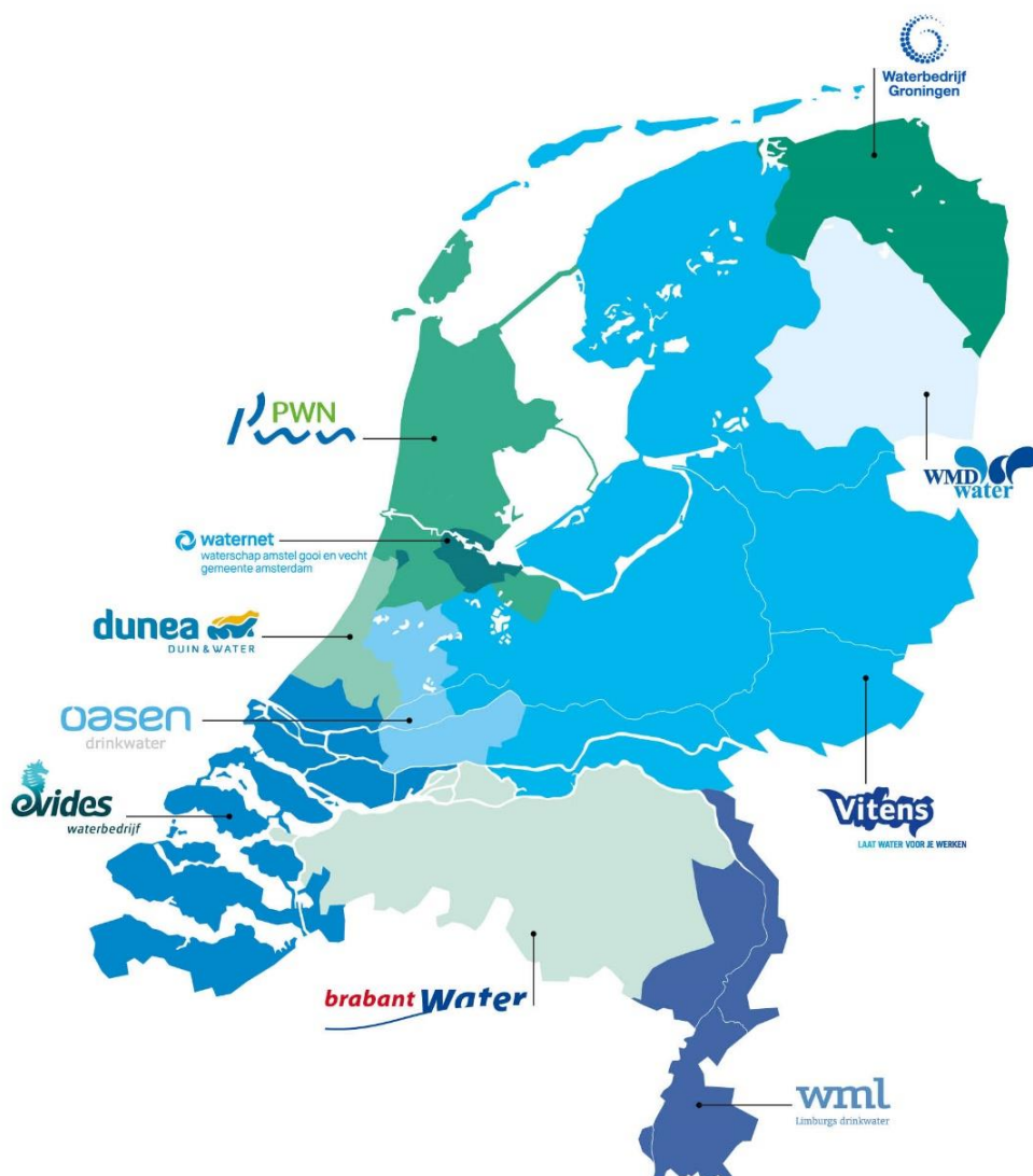
Figuur 1 : distributiegebieden van Nederlandse drinkwaterbedrijven (bron: Vewin)