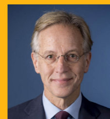
Robbert Dijkgraaf minister van Onderwijs, Cultuur en Wetenschap