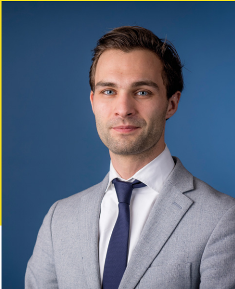
Maarten van Ooijen Staatsecretaris van Volksgezondheid, Welzijn en Sport

In dit boekje vindt u verhalen van 23 wethouders die hebben deelgenomen aan dit netwerk. Zij vertellen wat ze hebben bereikt, hun drijfveren en visie en wie hen heeft geïnspireerd. Ook geven zij tips aan collega's in andere gemeenten. Ik hoop dat hun verhalen u inspireren om net als deze wethouders aan de slag te gaan met het verbeteren van het jeugdbeleid, zodat alle jongeren gezond en veilig kunnen opgroeien.