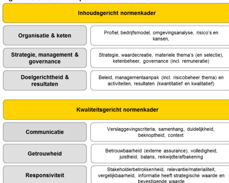
Figuur 2.3 Criteria Transparantiebenchmark 2021

In 2014 en 2019 zijn de criteria herzien. In 2014 is naar aanleiding van de evaluatie besloten meer aandacht te besteden aan de sectorspecificiteit en iMVO-prestaties. Ook hebben waarde-creatie en materialiteit een meer prominente plek gekregen. Daarnaast is meer aandacht besteed aan de implementatie van de OESO-richtlijnen voor multinationale ondernemingen. 22