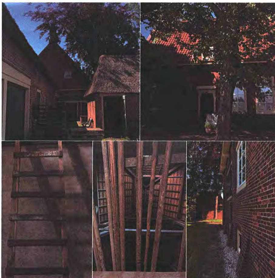
De 'Mariahoeve'

De 'Mariahoeve' is zonder bruidsschat is overgedragen omdat de hoeve over eigen inkomsten uit pacht beschikt, waaruit het onderhoud van het ensemble kan worden bekostigd.