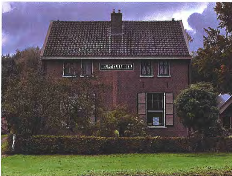
Een huis in Veenhuizen

Bij het ter perse gaan van dit jaarverslag is inmiddels bekend gemaakt dat het Ensemble Veenhuizen door het Rijksvastgoedbedrijf wordt overgedragen aan het consortium. Direct aansluitend zal het vastgoed worden overgedragen aan de daartoe opgerichte stichting 'De Nieuwe Rentmeester'. Met het vastgoed in deze stichting wordt het behoud van het ensemble gewaarborgd. De NMo beheert geen vastgoed en zal daarom ook geen zitting nemen in het Bestuur van de stichting. Met de overdracht is een belangrijk, monumentaal ensemble – dat mogelijk in 2021 deel zal gaan uitmaken van het Wereld Erfgoed – als geheel bewaard.