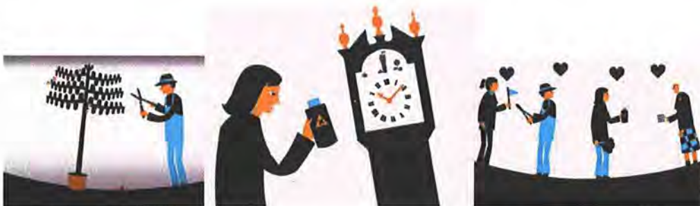
(Scènes uit het introductiefilmpje van Leer je Erfgoed)

In 2020 heeft de NMo bijgedragen aan de ontwikkeling van het platform door deelname in de Stuurgroep en de Projectgroep, de productie van een businesscase en een module en het voeren van gespreken met vertegenwoordigers van het monumentenveld met het oog op wensen en mogelijke deelname. Rond Open Monumentendag werd de komst van Leer je Erfgoed wereldkundig gemaakt met onder meer een speciaal voor het platform ontwikkeld filmpje: https://youtu.be/VW1yI9e7yKY .