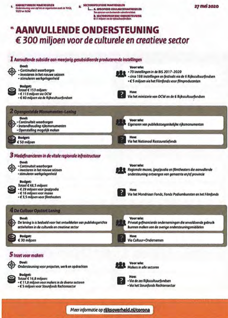
'Infographic' van de overheid met informatie over de Opengestelde Monumenten Lening

Na iedere spreker was er aansluitend ruimte om vragen te stellen. Bovendien werd de bijeenkomst afgesloten met een plenaire discussie tijdens de digitale borrel. Veel deelnemers maakten van de gelegenheid gebruik om ervaringen uit te wisselen.