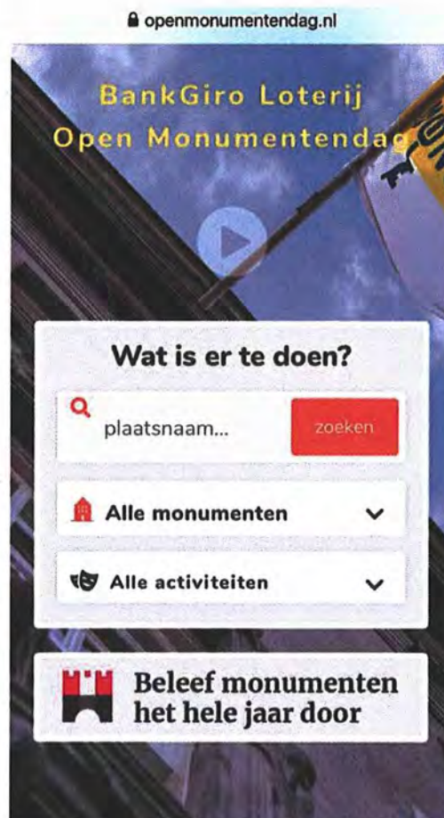
Schermafbeeldingen van de startpagina van de website van Open Monumentendag (in dit geval mobiele versie)

De weblink met logo en de tekst 'Beleef monumenten het hele jaar door' leverde het portaal een verdubbeling op van het bezoekersaantal: negen van de tien bezoekers landden in die tijd voor het eerst op het portaal.