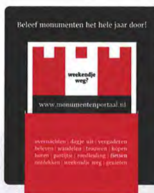
Informatiekaartje met display (Ontwerp: Degen & Leideritz)

Het Nationaal Monumenten Portaal is een initiatief van de Nationale Monumentenorganisatie