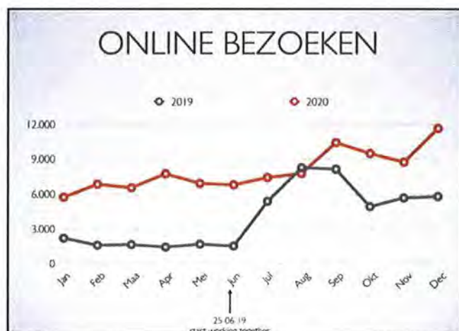
De online bezoeken aan het Monumentenportaal in 2020, vergeleken met 2019

Naast communicatie over het portaal op sociale media (LinkedIn, Facebook, Instagram), werd in 2020 opnieuw met behulp van het bureau INTK ingezet op het vergroten van het aantal bezoekers van het portaal. Dit bureau zet op professionele wijze de Google Grants in die aan de NMo als ANBI beschikbaar is gesteld. Deze inzet heeft in 2020 geresulteerd in ruim 96.200 bezoeken aan de website van het Monumentenportaal. Dit is een verdubbeling (+99%) ten opzichte van 2019 en komt neer op gemiddeld ruim 8.000 bezoeken per maand. De bezoekersaantallen waren in december 2020 het hoogst: deze maand werd afgerond met 11.650 bezoeken. De gemiddelde tijd die bezoekers in 2020 spendeerden op het portaal is lang: meer dan 3 minuten.