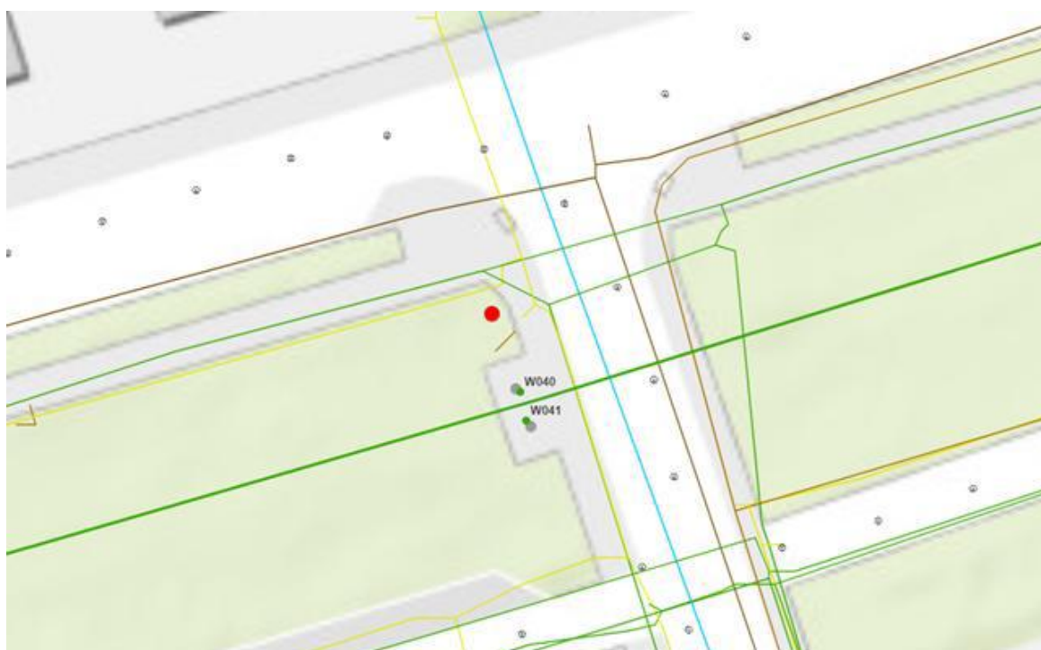
Figuur 1: Kaartbeeld containerlocatie

Figuur 1 (kaartbeeld containerlocatie) geeft de locatie van de beoogde containerlocatie weer op kaart. Figuur 2 (omgeving containerlocatie) geeft een sfeerimpressie van de directe omgeving en de precieze locatie (aangegeven met een rode stip).