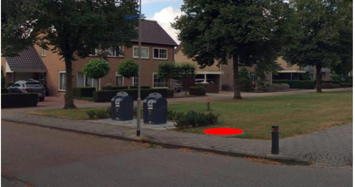
Figuur 2: Omgeving containerlocatie