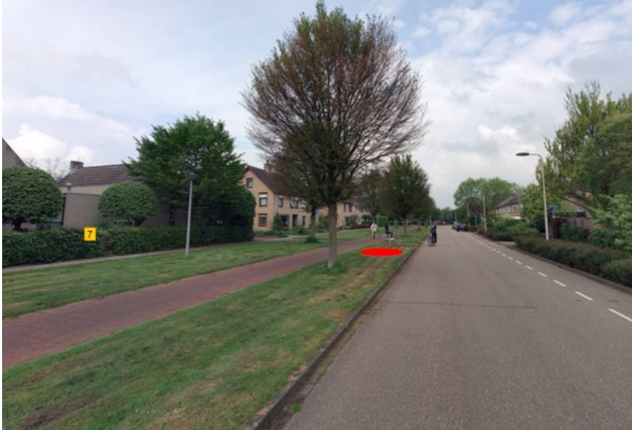
Figuur 2: Omgeving containerlocatie