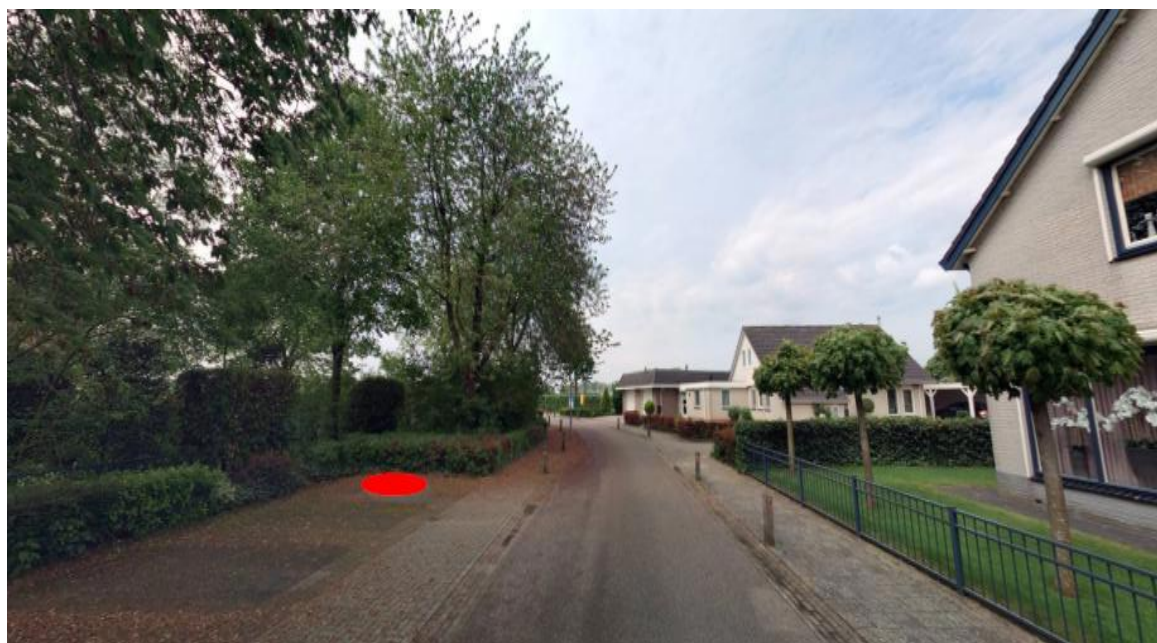
Figuur 2: Omgeving containerlocatie