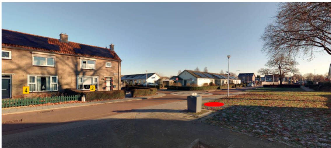
Figuur 2: Omgeving containerlocatie