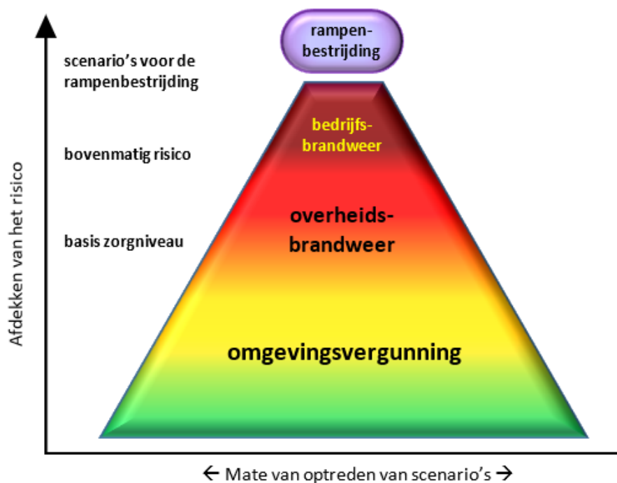
Figuur 1 Risicoafdekking openbare veiligheid