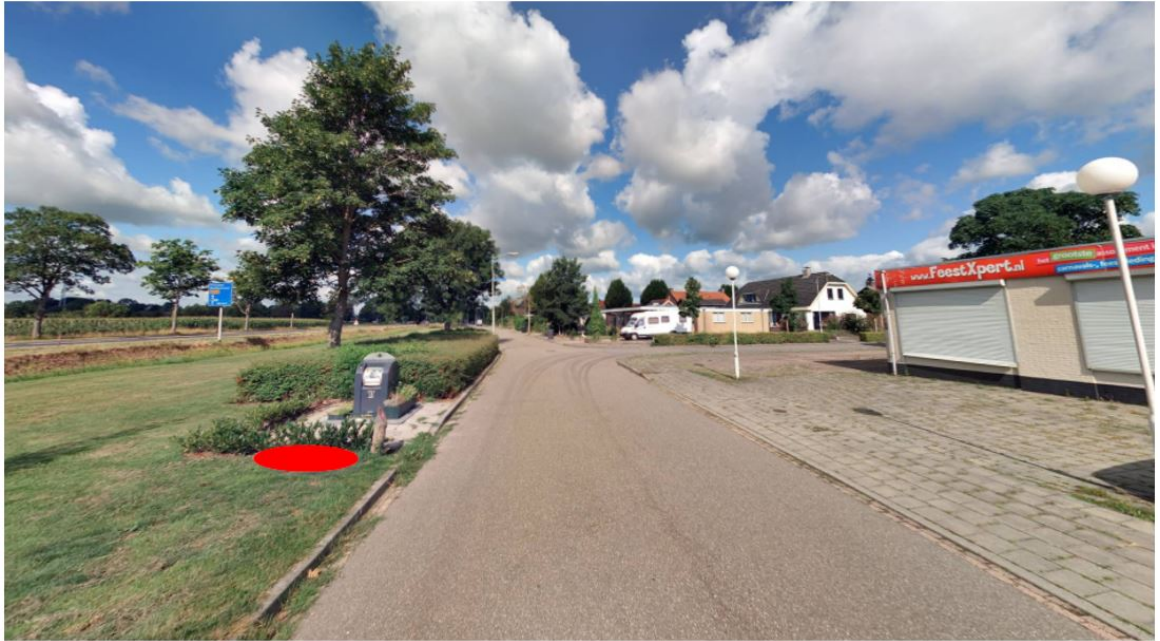
Figuur 2: Omgeving containerlocatie