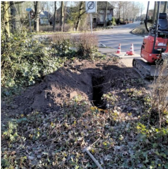
Figuur 3: Proefsleuf t.b.v. vrije ruimte voor INCO-container

Aangezien er in de huidige situatie al diverse andere (ondergrondse) containers worden gebruikt en geledigd aan de overkant van de straat, achten we deze locatie op het gebied van verkeersveiligheid en bereikbaarheid (voor het inzamelvoertuig) ook geschikt. In de directe omgeving liggen geen beschermingszones (A-watergangen) van het Waterschap of dijklichamen waar rekening mee gehouden dient te worden.