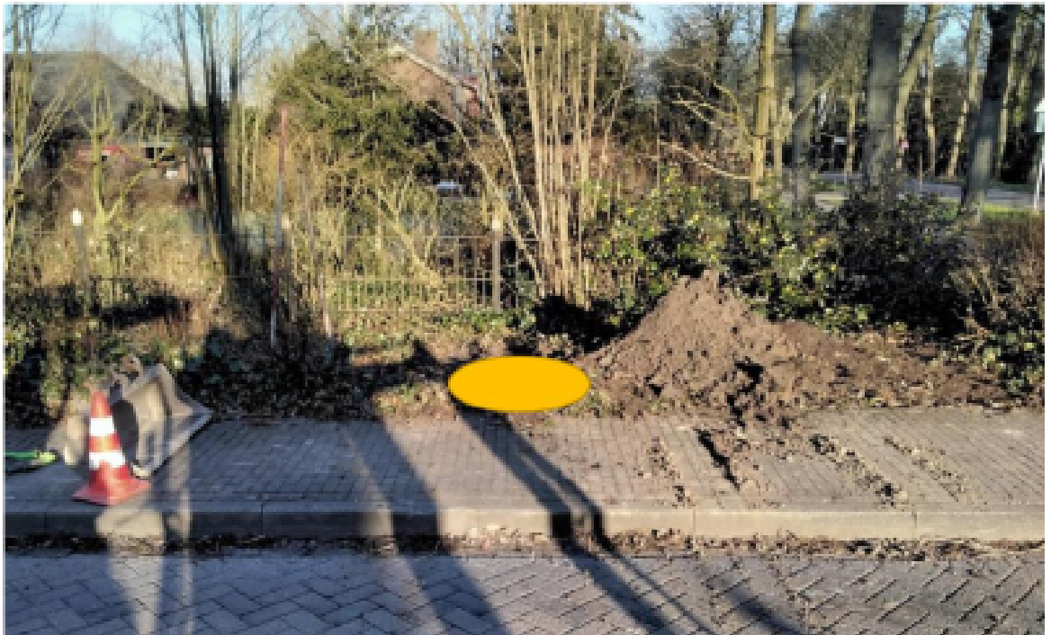
Figuur 2: Omgeving containerlocatie