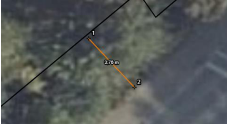
Figuur 4: Afstand trottoir tot erfgrens t.h.v. containerlocatie

Conclusie: De locatie voldoet aan de richtlijnen en is daarmee geschikt voor een INCO-container.