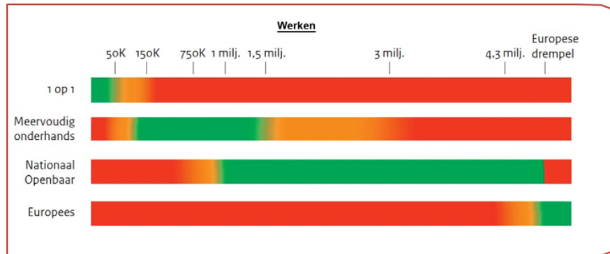
Figuur 2: Tabellen Gids P. drempelbedragen