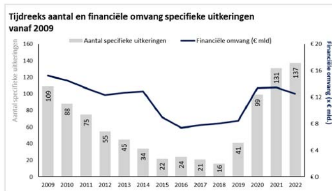
Figuur 2: Ontwikkeling specifieke uitkeringen vanaf 2009

Op basis van informatie over verstuurde beschikkingen is in Figuur 3 het aantal te verantwoorde specifieke uitkeringen in 2022 per gemeente inzichtelijk gemaakt 3 . In 2022 moeten de meeste gemeenten gemiddeld tussen de 15 en 25 specifieke uitkeringen verantwoorden. De G4 gemeenten hebben de meeste specifieke uitkeringen om te verantwoorden, alle vier 100 of meer specifieke uitkeringen. De provincies hebben gemiddeld tussen de 35 en 45 specifieke uitkeringen om te verantwoorden, dit zijn iets meer specifieke uitkeringen dan gemeenten