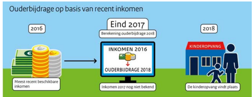
Figuur 2: Ouderbijdrage wordt vastgesteld op basis van recent inkomen

Op het moment dat de ouderbijdrage wordt berekend, is het inkomen t-2 in veel gevallen bekend. Het kan echter gebeuren dat DUO op het moment van aanvraag niet over een inkomengegeven uit t-2 kan beschikken, bijvoorbeeld bij ZZP'ers die uitstel hebben voor de aangifte van de inkomstenbelasting. Als er geen inkomen uit t-2 bekend is, wordt uitgegaan van het inkomengegeven van een jaar eerder (t-3) of, als dat ook niet beschikbaar is, het laatst bekende inkomengegeven. Op het moment dat het inkomengegeven t-2 alsnog beschikbaar komt in de BRI, wordt de ouderbijdrage herberekend op basis van dat gegeven. Dit zorgt er weliswaar voor dat de ouder te maken krijgt met een herberekening, maar voorkomt dat ouders hun belastingaangifte bewust gaan uitstellen om hun ouderbijdrage omlaag te krijgen.