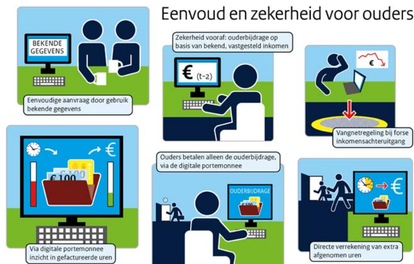
Figuur 1: Nieuwe financieringsstelsel biedt eenvoud en zekerheid voor ouders