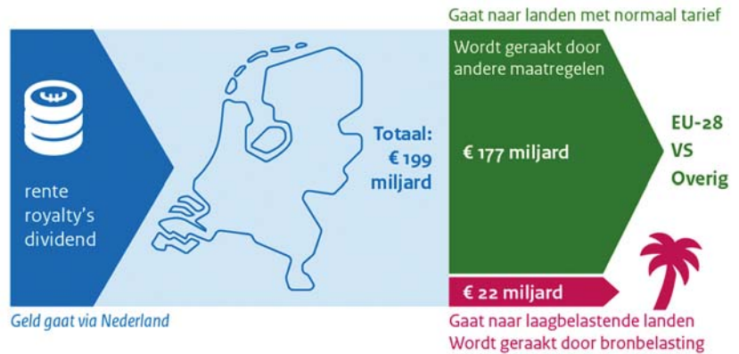
Figuur 1: Verdeling financiële stromen

De fiscaal relevante financiële stroom bestaat uit dividend, rente en royalty's. Deze bedragen in 2016 € 196 miljard aan inkomsten en € 199 miljard aan uitgaande betalingen. Het verschil tussen de omvang van de inkomsten en uitgaande betalingen wordt onder andere veroorzaakt doordat het hier de bedragen in een momentopname van één jaar betreft. Van de uitgaande betalingen gaat naar schatting € 22 miljard naar laagbelastende landen. Dat zijn landen zonder winstbelasting, een winstbelasting met een statutair tarief lager dan 7%, of landen die zijn opgenomen op de EU-lijst van niet-coöperatieve jurisdicties. Circa € 19 miljard (85%) van deze € 22 miljard bestaat vervolgens uit royalty's.