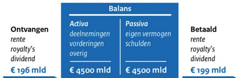
Figuur 2: balanstotaal met fiscaal relevante financiële stromen

SEO heeft ook de ontwikkeling van de stromen in de periode van 2004 tot en met 2016 in beeld gebracht. Daaruit blijkt een flinke groei van de uitgaande betalingen van € 72 miljard in 2004 tot € 199 miljard in 2016. De groei zit vooral in dividend en royalty's. SEO schrijft dat de groei van royalty's en licentie-vergoedingen, wereldwijd ongeveer vijf keer zo groot is als die van goederen en directe buitenlandse investeringen. Dat weerspiegelt hoe wereldwijde productie verschuift van fysieke grensoverschrijdende productie naar immateriële waardeketens. 15 SEO heeft de